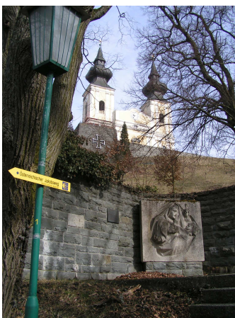
Maria Taferl, Jakobsweg

Ein Ausflug nach Maria Taferl in Verbindung mit einer Stadtführung in Melk, Pöchlarn oder Ybbs, oder einem Besuch des Schlosses Artstetten, ist ein Nachmittag, an den Sie sich gern erinnern werden.