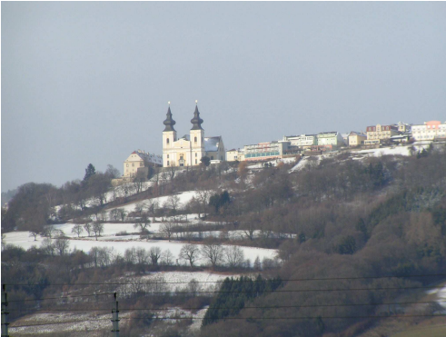
Maria Taferl im Winter