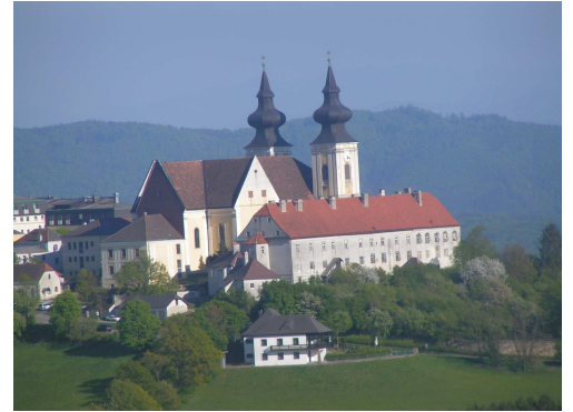
Maria Taferl im Sommer

Maria Taferl ist der größte Wallfahrtsort in Niederösterreich und Station des Jakobswegs.