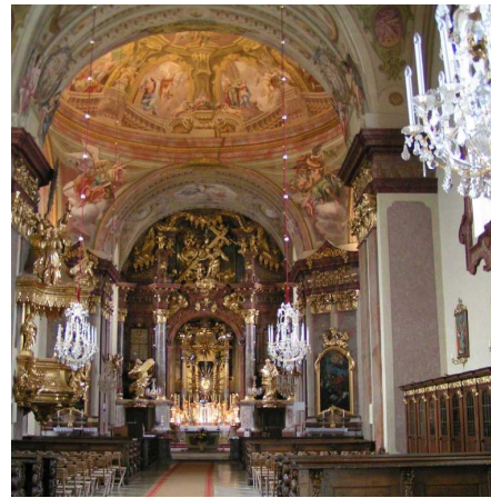
Maria Taferl, Hochaltar

Besonderer Höhepunkt ist heuer das Gedenkjahr für den Baumeister von Stift Melk, Jakob Prandtauer. Dazu bietet sich ein Ausflug nach Maria Taferl an – dem bedeutensten Wallfahrtsort in Niederösterreich, mit einer Basilika, die heuer ihr 350jähriges Jubiläum feiert und bei deren Bau Jakob Prandtauer ebenfalls mitgewirkt hat.